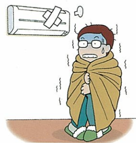
事前にご連絡ください。