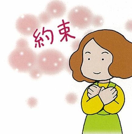
管理規約や契約内容の遵守を。