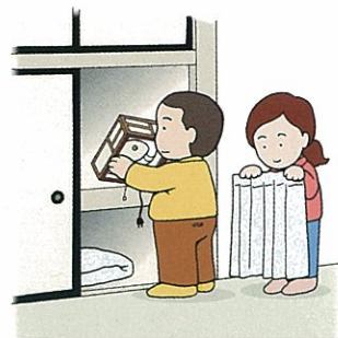
残置物は保管ください。

(カーテン・照明・エアコン・ロールカーテン等)退去時まで保管いただくことが前提となります。取り外し収納してください。勝手に処分されますとご負担を戴くこととなりますのでご注意ください。